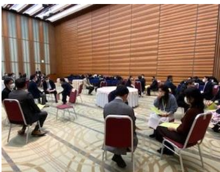
企業の若手役員を対象とした「フォーラム21」参加者との懇談（拡大講座）