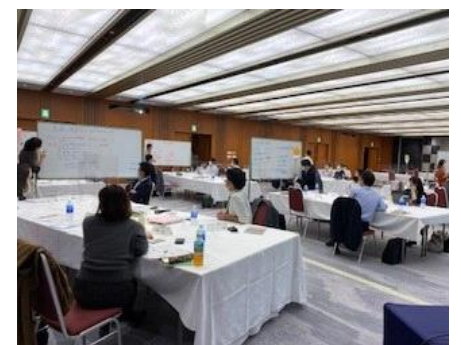
スキル系講座 年間プログラムを通し、異業種メンバーとのグループディスカッションを重ねていきます

座学だけでなく、グループ討議やワークショップなどを通じて実践的な業務遂行力や異業種交流による人脈形成も図ります。