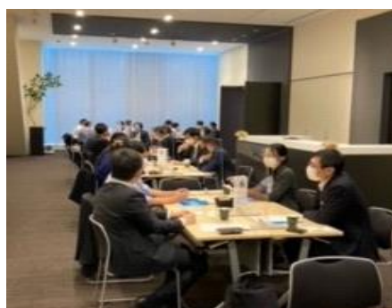
講座開始前の異業種交流会