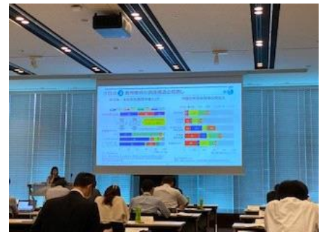
マインド系講座 職業人としての視野を拡大し、将来の展望を描く

第一線で活躍する実務家・専門家を講師に迎え、キャリアデザインやリーダーシップなど、職業人としての自己をみつめ、将来の展望を描く「 マインド系講座 」と、ロジカル・コミュニケーションやマネジメント、ビジネスデータ分析、マーケティングなど、業務実践力を高める「 スキル系講座 」を組み合わせ、幅広く体系的に学ぶプログラムを提供します。